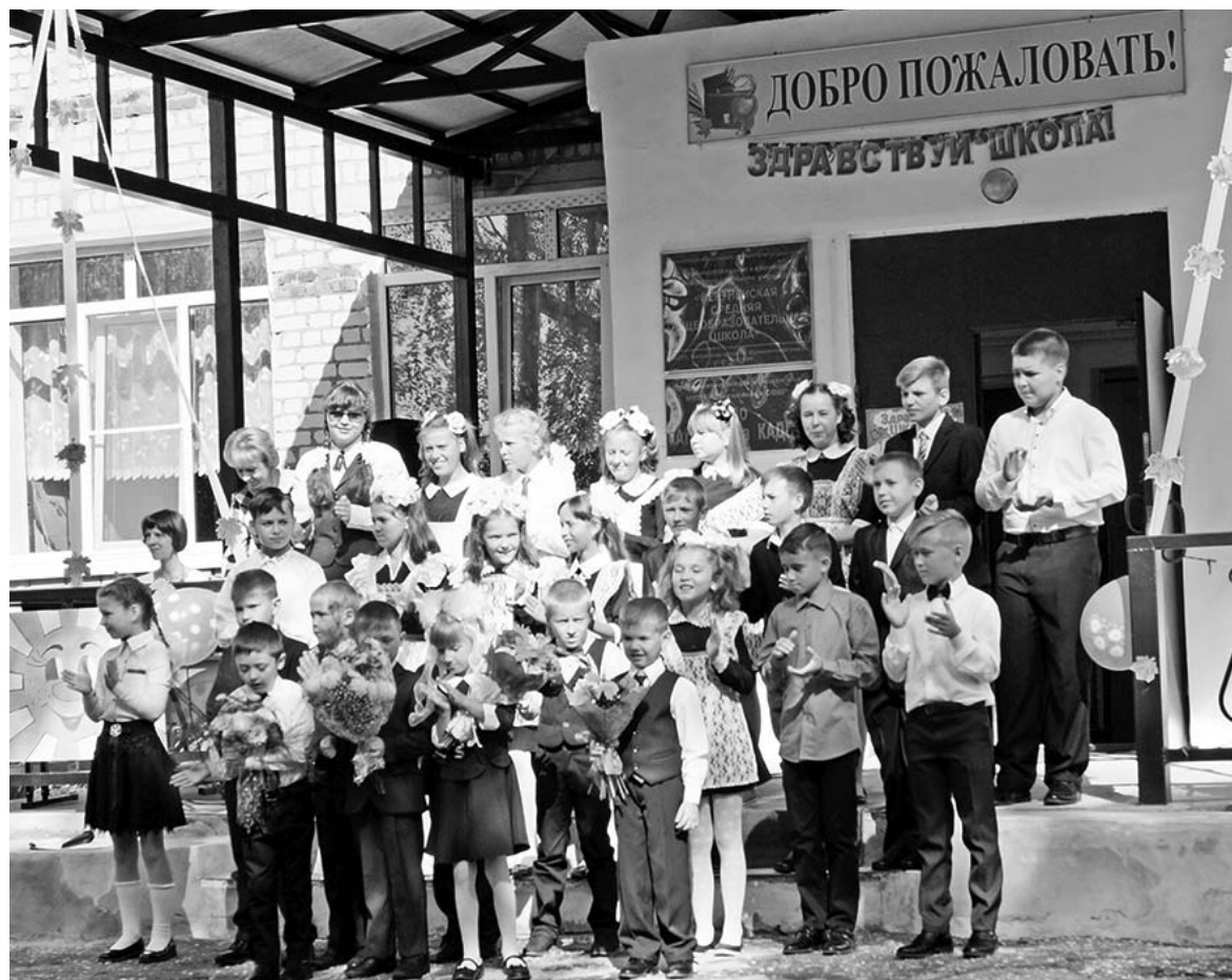
Вертное. Добро пожаловать в школу!

Трогательное поздравление подготовили будущие пер-